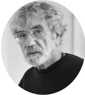
Humberto Maturana Romesín

Estudió Medicina en la Universidad de Chile y luego se trasladó al University College London para estudiar anatomía y neurofisiología. En 1958 obtuvo el Doctorado en Biología de la Universidad de Harvard. En el año 1994 recibió el Premio Nacional de Ciencias en Chile.